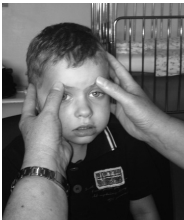
Slika 3. Prikaz vježbi mimičke terapije – stvaranje transversalnih nabora kože (uz suglasnost roditelja).