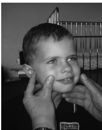
Slika 5. Prikaz vježbi mimičke terapije – podizanje kuta usne (uz suglasnost roditelja).