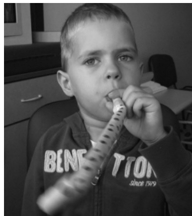
Slika 7. Prikaz vježbi mimičke terapije – puhanje (uz suglasnost roditelja)