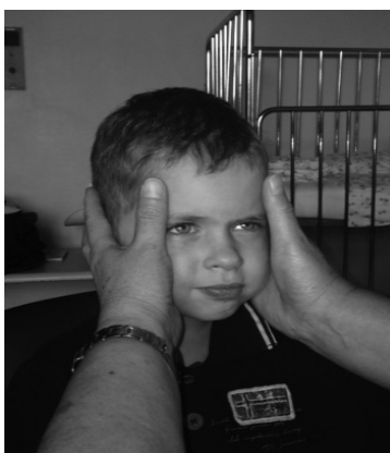
Slika 4. Prikaz vježbi mimičke terapije – stvaranje vertikalnih nabora kože (uz suglasnost roditelja).