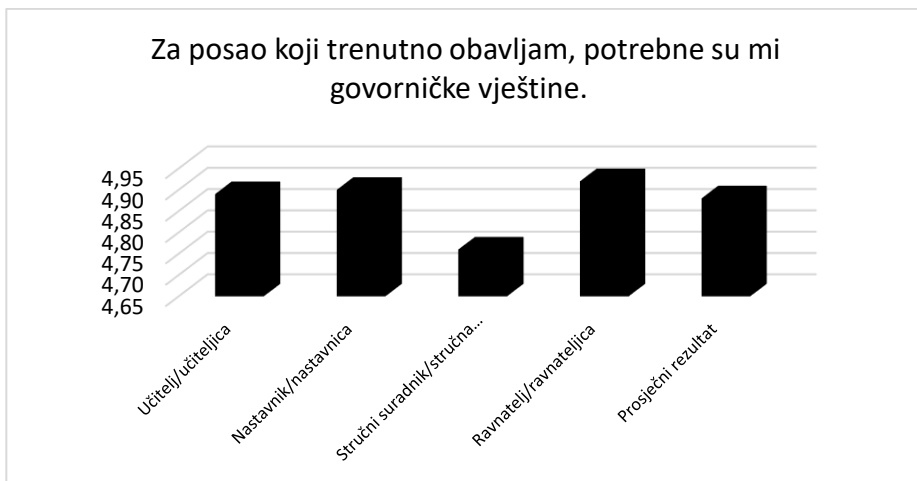
Slika 3. Prikaz prosječne ocjene slaganja s tvrdnjom s obzirom na vrstu radnog mjesta Figure 3. Arithmetic mean for statement by type of job position

Rezultati jednosmjerne analize varijance pokazali su da postoji statistički značajna razlika ( F = 5.96 , p < 0.001 ) između tvrdnje Za posao koji trenutno obavljam, potrebne su mi govorničke vještine i vrste radnog mjesta. Prosječni rezultat na razini svih ispitanika govori o visokom stupnju slaganja s tvrdnjom ( M = 4.88 , SD = 0.41 ), ali provedena analiza pokazala je i međusobno razlikovanje unutar radnih mjesta ispitanika. Prema tome, ravnatelji su u najvećoj mjeri samoprocjenili važnost potrebnih govorničkih vještina za njihov posao ( M = 4.92 , SD = 0.31 ), zatim slijede nastavnici ( M = 4.90 , SD = 0.38 ), učitelji ( M = 4.89 , SD = 0.44 ) te stručni suradnici ( M = 4.76 , SD = 0.53 ).