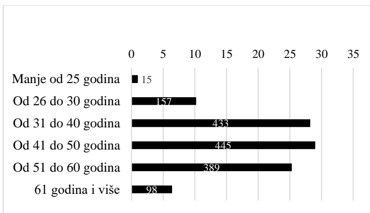
Slika 1. Prikaz ispitanika prema dobnim razredima

Ciljana populacija istraživanja obuhvaća odgojno-obrazovne djelatnike osnovnih i srednjih škola Republike Hrvatske. Prikupljen uzorak istraživanja sastoji se od 1537 ispitanika. U istraživanju je sudjelovalo 78.5% (N = 1260) žena, 20.8% (N = 320) muškaraca te 0.7% (N = 11) onih koji se nisu željeli izjasniti. Od ukupno 21 županije u istraživanju su sudjelovali ispitanici iz svih županija osim iz Vukovarsko-srijemske. Slika 1 prikazuje distribuciju ispitanika prema dobnim razredima.