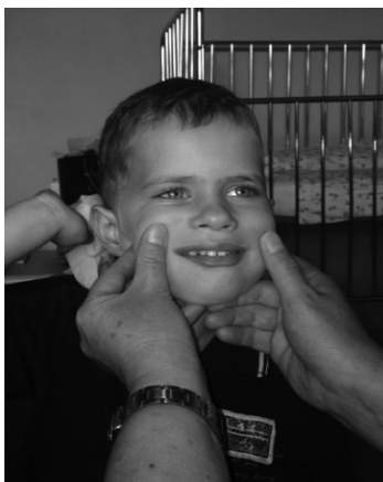
Slika 6. Prikaz vježbi mimičke terapije – osmjeh (uz suglasnost roditelja).