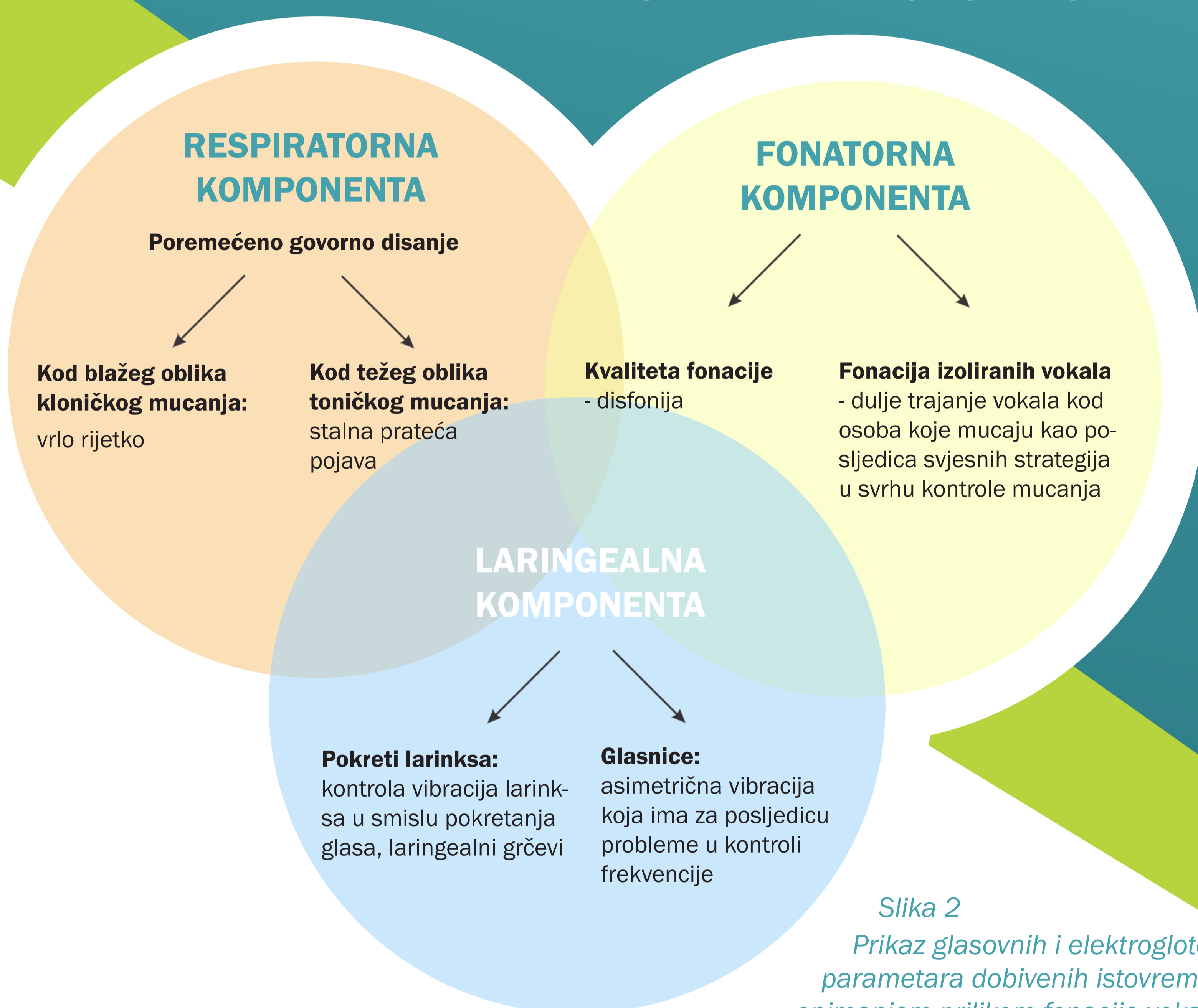
Slika 2 Prikaz glasovnih i elektroglotografskih parametara dobivenih istovremenim snimanjem prilikom fonacije vokala „e“

Početak mucanja: predškolska dob Jakost mucanja procijenjena Riley upitnikom: 12 % - blago mucanje Pacijent je uključen u govornu terapiju po VT metodi u Poliklinici SUVAG, od 2007.g. godinu dana prije elektroglotografskog snimanja. Tijekom ispitivanja ispitanik je fonirao vokal „e“ u mikrofon koji je bio udaljen od njegovih ustiju oko pet centimetara, a snimanje je trajalo pet sekundi. Nakon toga dobiveni su elektroglotografski i glasovni parametri.